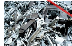
Ferraille - canettes