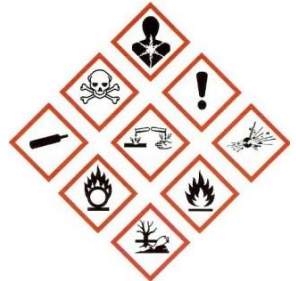
Déchets ou emballages de produits dangereux