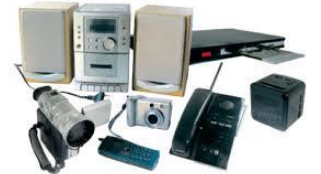
DEEE: Déchets d'équipement électrique et électronique