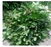
Souches, bois non traités et déchets verts